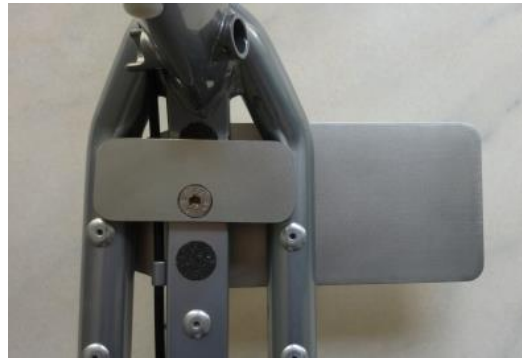
Fußkonsole FKS rechts

Hier gilt die gesetzliche Gewährleistungsfrist. Schäden die durch unsachgemäße Beanspruchung, Gewalteinwirkung, unzureichende Wartung oder normalen Verschleiß, usw. entstehen, sind von der Gewährleistung ausgeschlossen.